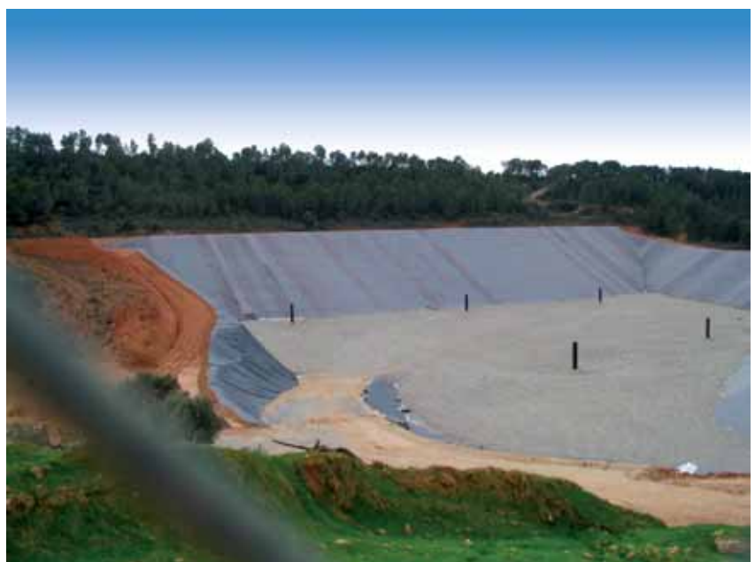
Abocador de Tivissa.

En el meu cas, en cap moment em passarà pel cap acomiadar un immigrant que porta treballant molt temps en l'empresa per posar una persona que vingui de l'atur... i menys amb exigències.