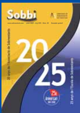
Portada commemorativa: 25 anys de l'Escola de Sobreestants. 20 anys de l'Associació de Sobreestants.