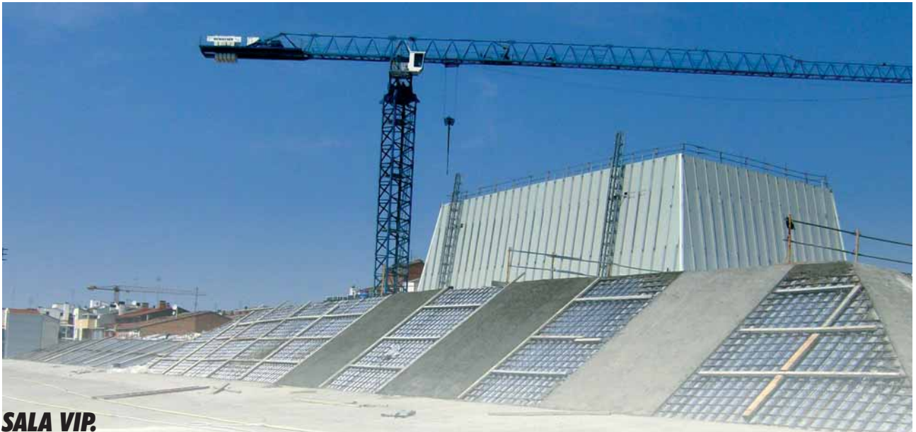
Vista coberta Llotja