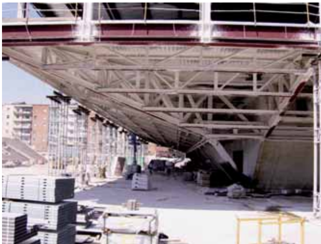
Vista voladís plaça