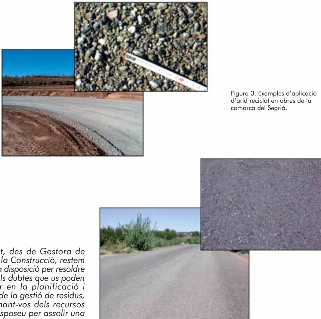
Figura 3. Exemples d'aplicació d'àrid reciclat en obres de la comarca del Segrià.

També des de la perspectiva ambiental, és favorable procurar la presència de materials reciclats i d'altres articles i productes provinents del reciclatge en les partides de materials: això no només millora l'impacte ambiental de l'obra, sinó que sovint, com succeeix amb l'àrid reciclat, comporta un abaratiment en el preu de subministrament. De fet, és el mateix Reial Decret el que convida a què els promotors públics fomentin la presència d'àrid reciclat i altres productes provinents de la valorització de residus en les unitats d'obra dels projectes.