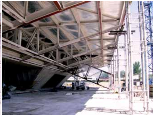
Vista voladís costat riu

La sala disposa de serveis i cabines de traducció simultània.